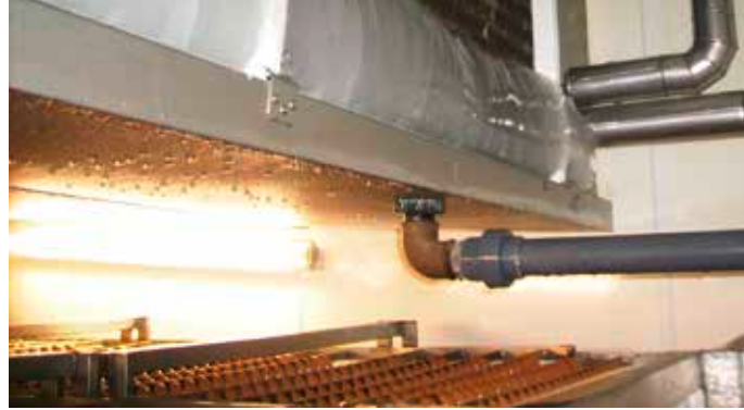
Vereisung am Kühlregister als Auswirkung von Feuchteverschleppungen. / Icing-up of the cooling coil as an effect of moisture carry over.

Kaum ein anderer Umwelteinfluss bestimmt die Produktqua-