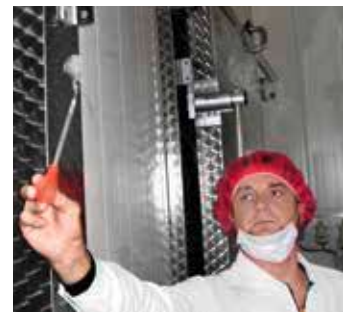
Visualisierung der Luftströmungsverhältnisse. / Visualising the air flow conditions.

On completion of the hygiene climatic process environment data recording, the results can be used to devise reliable op-